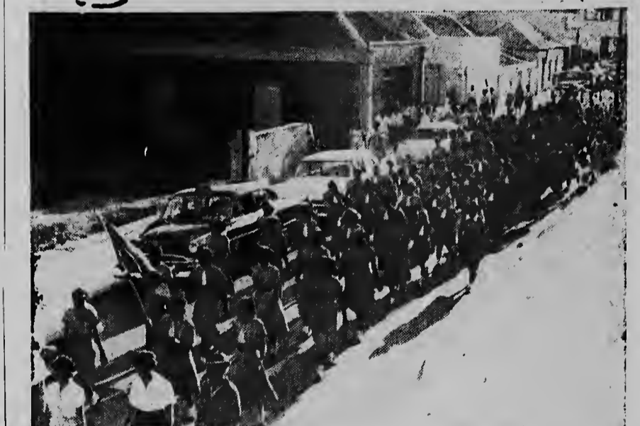
De padvinders tijdens de mars door Oranjestad.